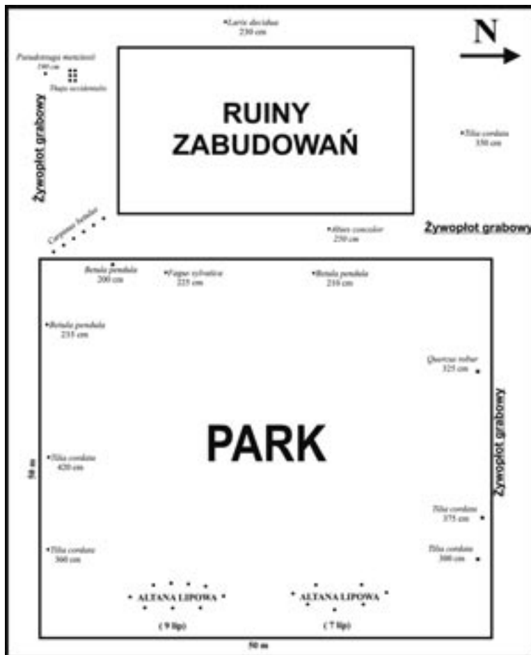
Ryc. 2. Plan rozmieszczenia XVIII-wiecznego drzewostanu w parku i w jego otoczeniu (oprac. Iwona Kaźmierska)