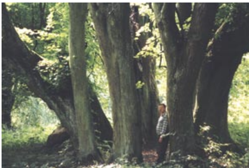
Ryc. 3. Południowa altana lipowa

Obie altany lipowe znajdują się w części wschodniej parku. Altana południowa, o całkowitym obwodzie kręgu 15 m i średnicy 4,95 m, składa się z dziewięciu lip (Ryc. 3). Obwody pni lip (mierzone na wysokości 1,3 m) wynoszą: 200, 196, 140, 285, 283, 290, 220, 200 i 145 cm. Druga z altan (północna), o całkowitym obwodzie kręgu 14,6 m i średnicy 4,30 m, utworzona jest z siedmiu drzew.